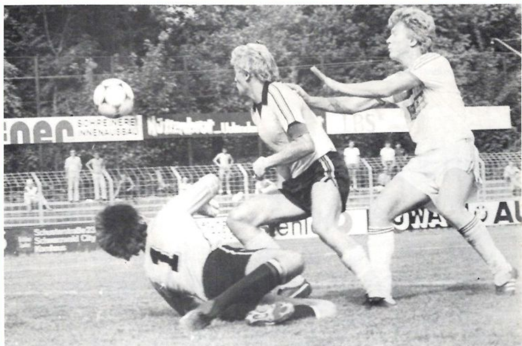
Spieldzene aus dem Heimspiel gegen die SpVgg. Ludwigsburg 1 : 1.