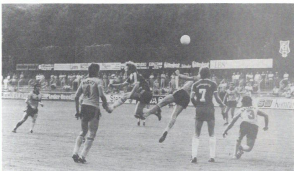
Kampfszene aus dem Spiel FFC gegen FC Rastatt